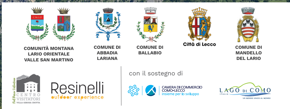
grafica: laPaPa | legrigne-studio2associato.it

LE GRIGNE E IL PARCO VALENTINO: IL CUORE DELL'ALPINISMO E DELLA BIODIVERSITÀ