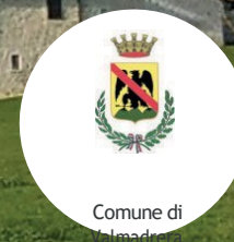
Comune di Valmadrera