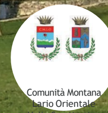
Comunità Montana Lario Orientale Valle San Martino