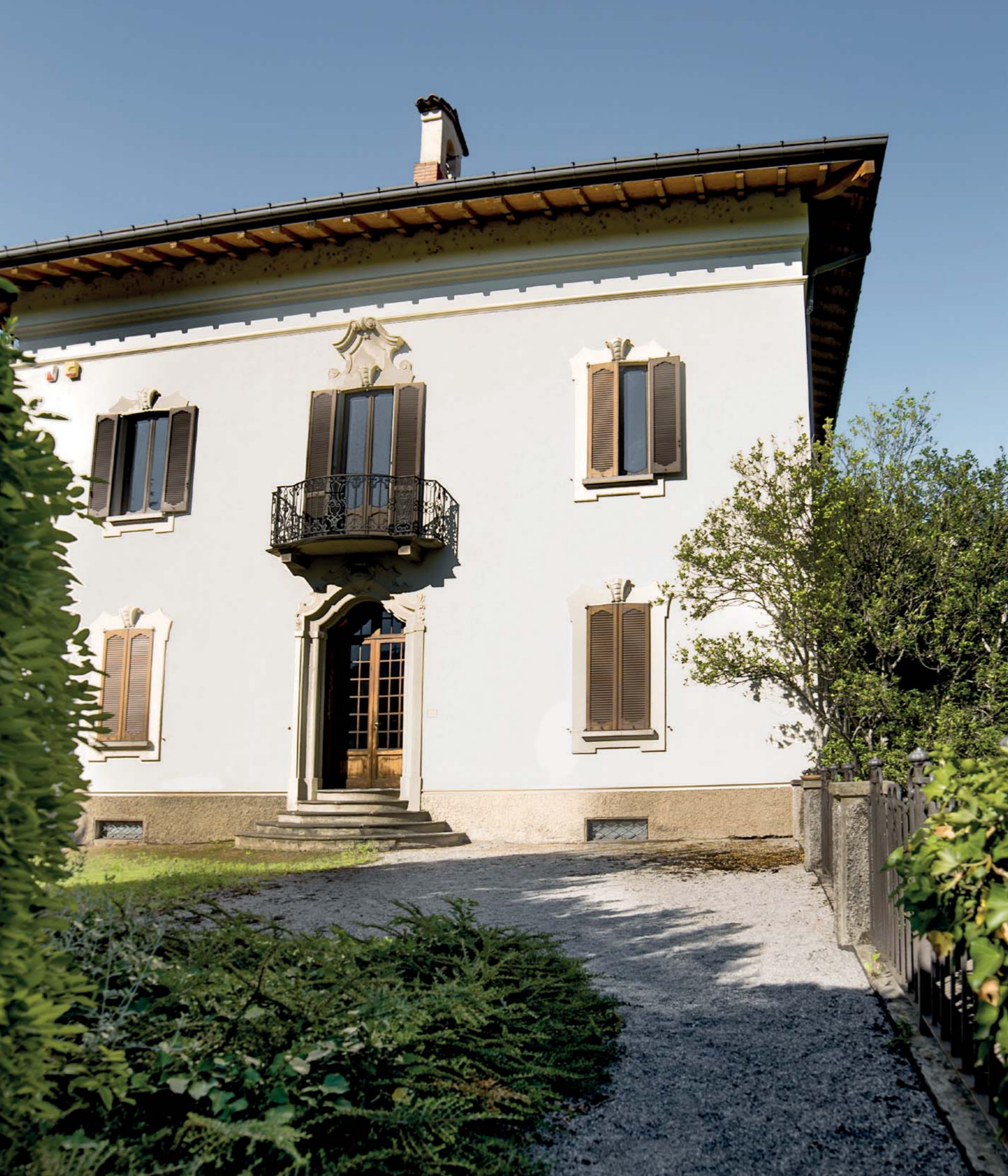
Villa de Ponti, attuale sede istituzionale della Comunità Montana Lario Orientale - Valle San Martino. Edificata nel 1925, fu residenza dell'omonima famiglia che legò le sue sorti a quelle della fabbrica "Sali di Bario" e di Calolziocorte grazie all'illustre figura di Gaspare de Ponti a cui è intitolato il pregevole giardino botanico che la circonda, prima emergenza naturalistica dell'"Ecomuseo Val San Martino".