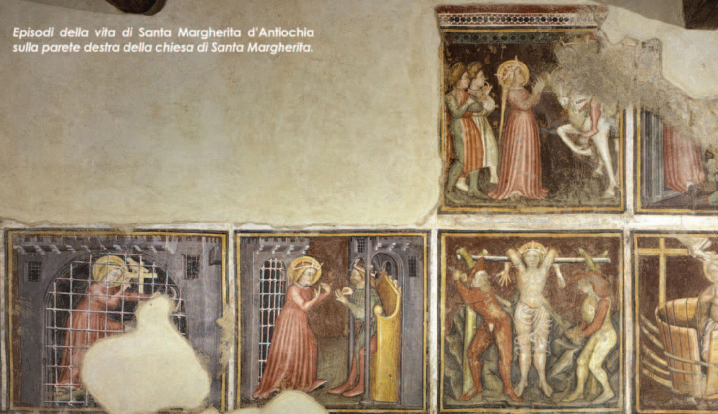
Episodi della vita di Santa Margherita d'Antiochia sulla parete destra della chiesa di Santa Margherita.

Questi, intervallati da tre monofore, raffigurano, da sinistra a destra: Santa Caterina d'Alessandria , un Dottore della Chiesa , la Trinità , un Santo non identificato, l'Incontro di Maria con Gesù sulla via del calvario e il Martirio di santa Caterina d'Alessandria . In questi affreschi e nel mutilo Angelo annunciante sul pennacchio sinistro dell'arco trionfale si ritrovano la medesima ricerca di effetti plastici, le raffinatezze cromatiche e quel senso di viva cordialità che anche nelle Storie di santa Margherita d'Antiochia ridimensiona il potenziale drammatico insito nel racconto. Sono stati inseriti nella campagna che vede attivo il "Maestro di santa Margherita" anche due affreschi originariamente collocati sulla parete sinistra della navata, di cui rimane una testimonianza fotografica: il Vir dolorum , staccato e trafugato, che si trovava al di sopra dell'ingresso laterale, e la vicina Madonna del latte , di cui è visibile una labile traccia.