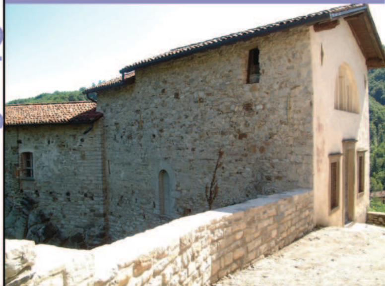
Prospetto laterale della chiesa di Santo Stefano

Aperture straordinarie nel periodo estivo