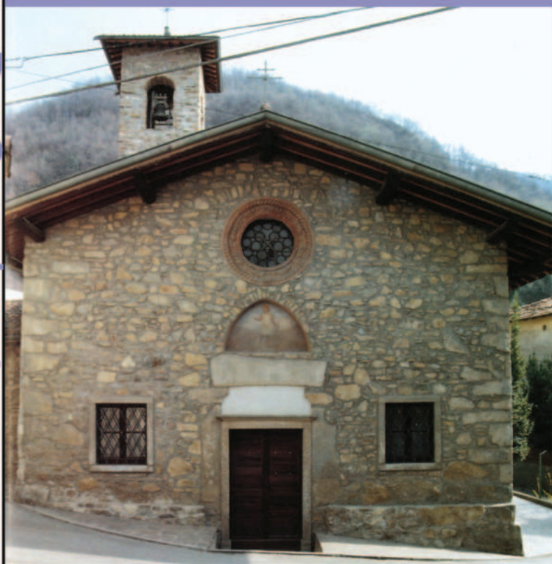
Facciata della chiesa di San Defendente.

Per informazioni telefonare alla Parrocchia di San Gottardo n. 035-785037