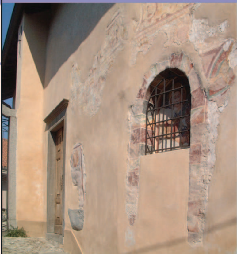
Prospetto laterale della chiesa di San Lorenzo "vecchio".

Per informazioni telefonare alla Parrocchia di San Lorenzo n. 0341-643259