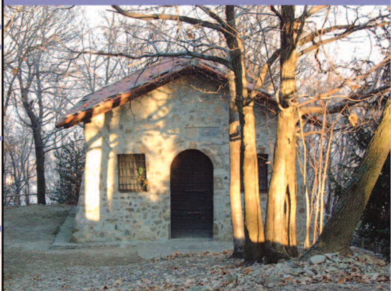
Facciata della chiesa di Santa Margherita.

Alla sommità di via G. Donizetti, nel Comune di Monte Marengo, imboc- care il sentiero sterrato, a sinistra, dalla località Portola. La chiesa si raggiunge dopo circa 30 minuti di percorrenza a piedi, con un dislivello di circa 100 metri. Le persone con difficoltà motorie possono rivolgersi in Comune (n. 0341 - 602200) per un possibile trasporto con fuoristrada (solo su prenotazione).