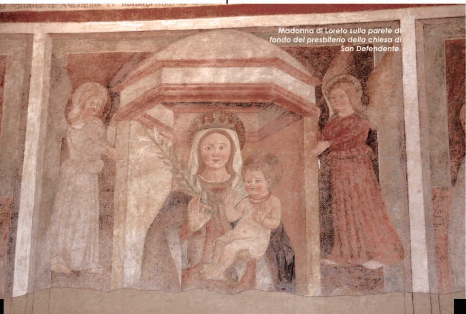
Madonna di Loreto sulla parete di fondo del presbitero della chiesa di San Defendente.

Lacerti di affreschi quattro-cinquecenteschi di fattura arcaizzante sono visibili in altre parti della chiesa, tra i quali la Crocifissione sul pilastro sinistro dell'arco trionfale, un probabile San Giobbe , con il corpo ricoperto di piaghe, sul pilastro destro, la Madonna con Bambino in trono e Santa Caterina d'Alessandria sulla parete destra della navata. Su questo stesso lato, presso il semipilastro dell'arcone, è visibile il Vir dolorum .