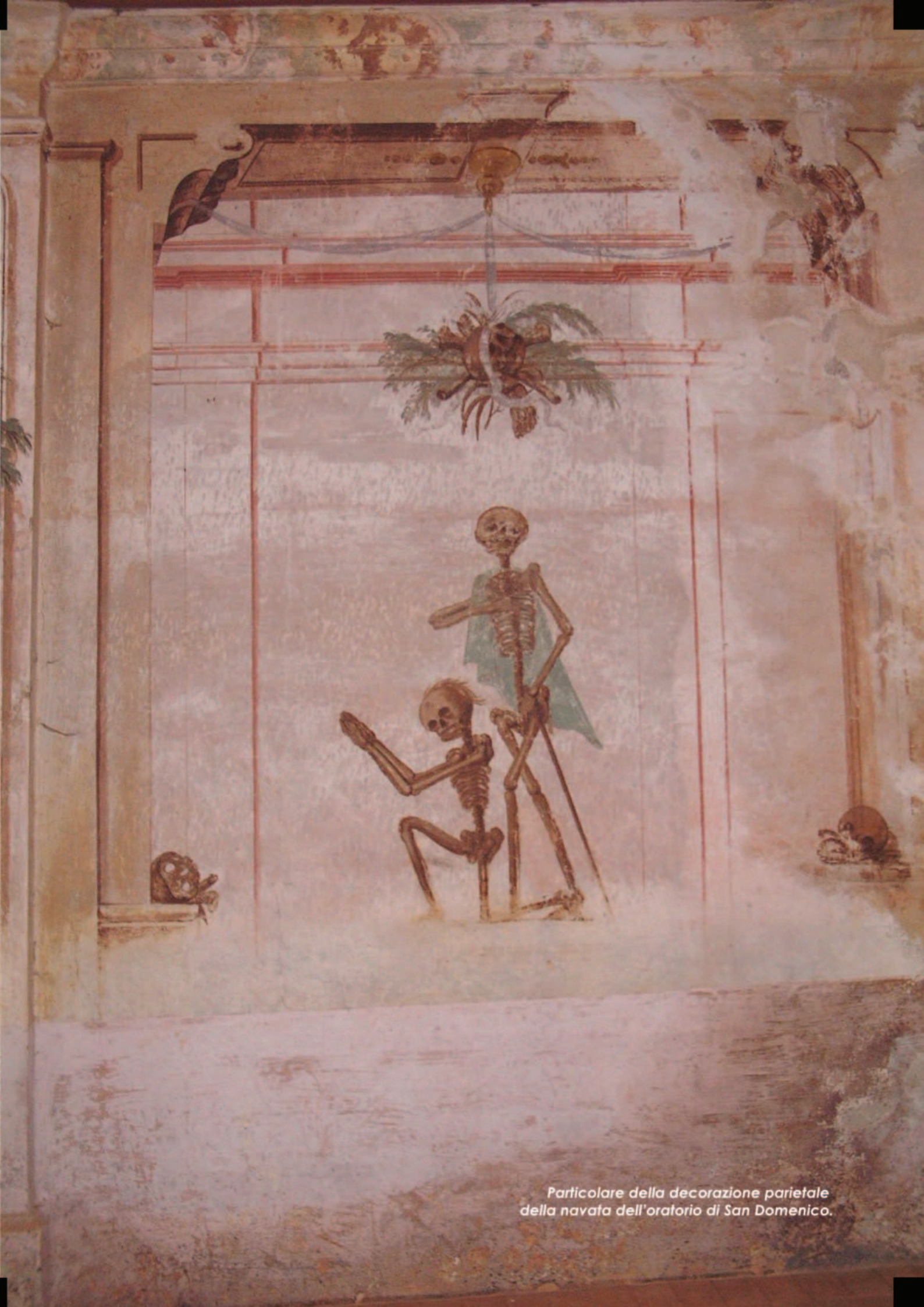
Particolare della decorazione parietale della navata dell'oratorio di San Domenico.