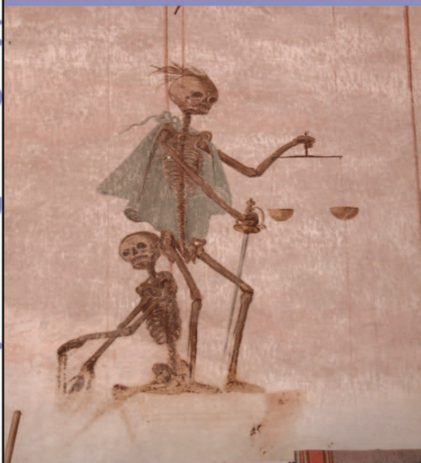
Particolare della decorazione parietale della navata dell'oratorio di San Domenico.

Aperture straordinarie nel periodo estivo