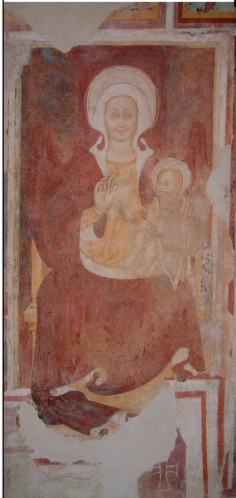
Madonna in trono con Gesù Bambino nel secondo vano della chiesa di Santo Stefano.

La svolta rinascimentale della cultura figurativa lombarda procurò localmente timidi aggiornamenti, avvertibili in alcuni affreschi nell'abside sinistra della chiesa di Santa Maria del Lavello a Calolziocorte e, soprattutto negli eleganti cicli cinquecenteschi eseguiti dalla bottega dei Marinoni in diversi ambienti del monastero di San Giacomo Maggiore a Pontida (cfr. itinerario Vie della Fede 1).