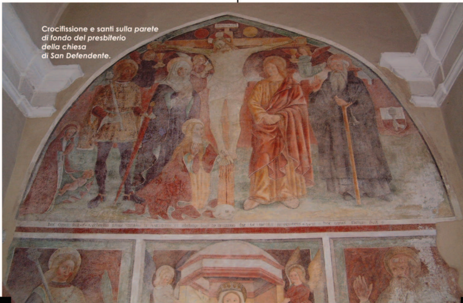
Crocifissione e santi sulla parete di fondo del presbiterio della chiesa di San Defendente.

ei) Judas non ille scar(iotis)" (Gv 14, 22). La figura indica il presbiterio dove appare, sulla parete di fondo, l'affresco con la Crocifissione tra San Defendente e la Madonna , a sinistra, Santa Maria Maddalena ai piedi della croce , San Giovanni Evangelista e Sant'Antonio Abate a destra (all'estrema sinistra, inoltre, si trova, in posizione appartata, la Madonna in adorazione del Bambino ). Al di sotto della Crocifissione , entro tre riquadri incorniciati da un bordo lineare, sono affrescate, rispettivamente, le figure lacunose con San Defendente , la Madonna con Bambino e Sant'Antonio Abate . Il ciclo è completato da un lacerto con San Cristoforo , sulla parete destra, e da una serie lacunosa sulla parete sinistra del presbiterio costituita da tre riquadri raffiguranti San Michele , Santo Stefano e Santa Caterina d'Alessandria .