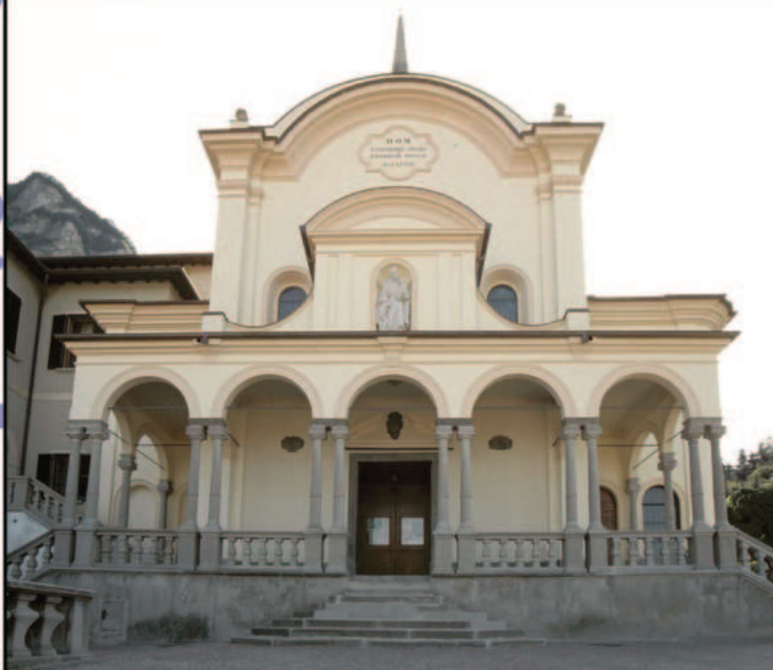
Facciata del santuario di San Girolamo Emiliani.

La Valletta apertura: Lunedì - Sabato ore 8,00 - 16,30 (17,30 nei mesi estivi) Domenica: ore 7,30 - 16,30 (18,30 nei mesi estivi)