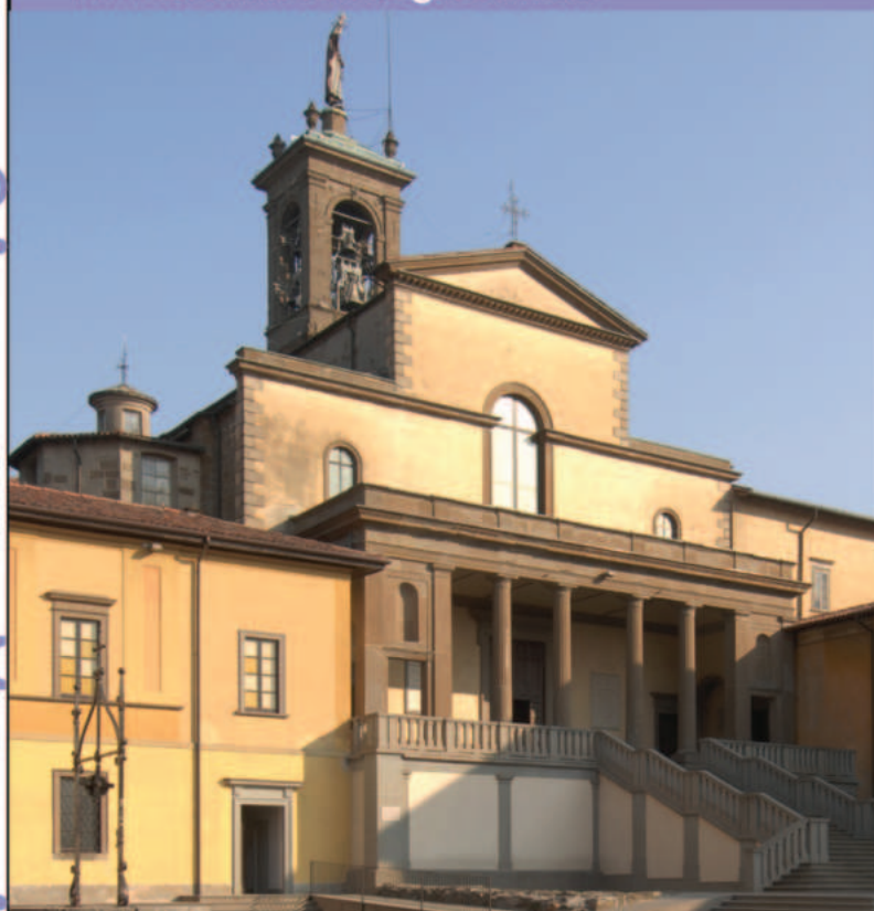
Facciata della chiesa abbaziale di San Giacomo Maggiore.

A sinistra Veduta d'insieme della cappella sinistra della chiesa di Santa Maria del Lavello.