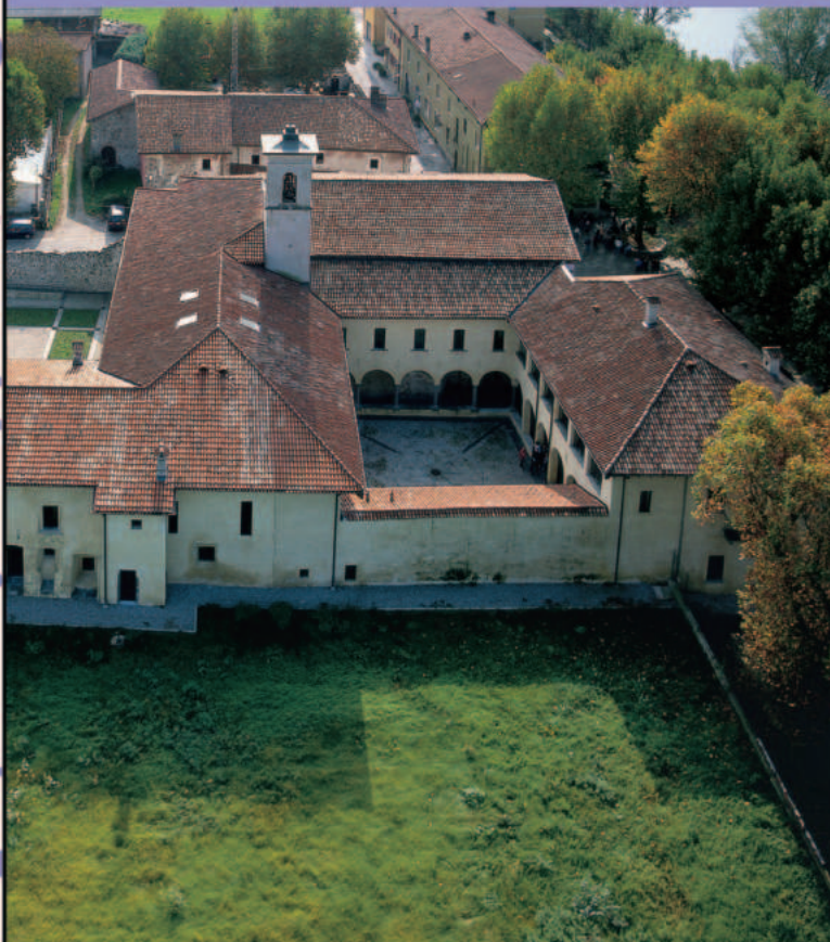
Convento di Santa Maria del Lavello: il chiostro minore con l'annessa chiesa.